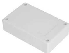
Interface autres couplages