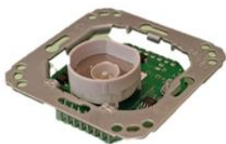
Prise magnétique Ack